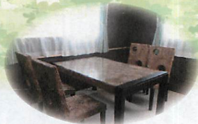
※写真はネクストライフグループ施設です。